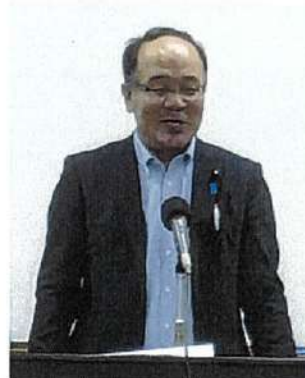
大石県議会産業委員会委員長