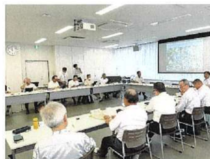
菊川市農業委員会アクタバ操作研修

菊川市では昨年度試験的にアクタバを利用していたが、今年8月から始まる利用状況調査で、全地区でアクタバを導入し本格的に利用していく予定だ。