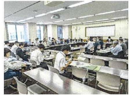
常設審議委員会の様子

なお、令和6年5月の県内における農地転用許可案件については11頁（県農地調整課まとめ）のとおり。