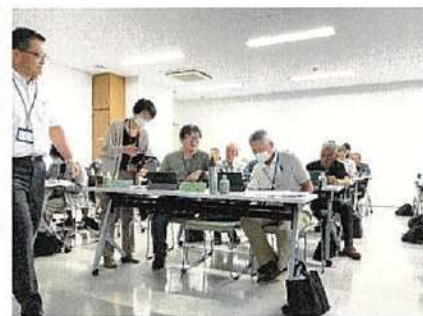
タブレット導入研修会 小山町（左）、藤枝市（右）