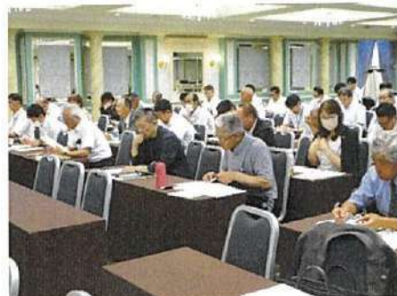
会長・事務局長会議の様子

出席者アンケートでは、「地域計画を進めていく上で具体的に農業委員会や事務局で行うことが明確になった」、「食料・農業・基本法の改正についてのポイントは分かりやすく参考になった」「農地を農地として次世代にバトンを渡す必要性を強く感じた」などの感想が寄せられた。